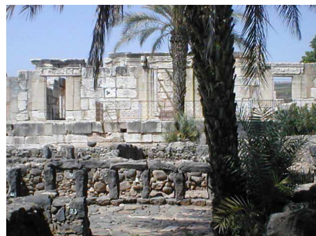
Sinagoga di Cafarnao