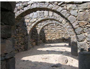
Resti di Corazin

Corazin, Betsaida, città imperiale, e soprattutto Cafarnao, dove abitava Pietro, sono i luoghi, dove Gesù ha operato la maggior parte dei suoi segni di potenza, i miracoli, e dove c'è stata la maggior evangelizzazione. Cafarnao si è perduta nella storia ed è stata riscoperta, come città, solo il secolo scorso: “Cafarnao, sarai precipitata negli Inferi” , perché non ha accolto il messaggio di Gesù.