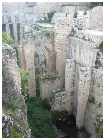
Piscina di Betsaida